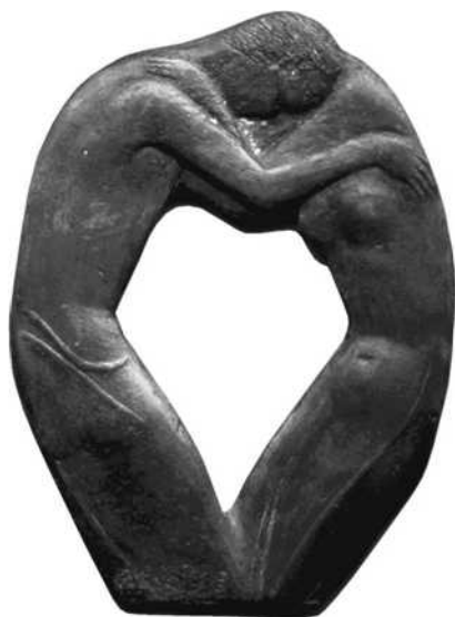
38 verkleind schaal ½