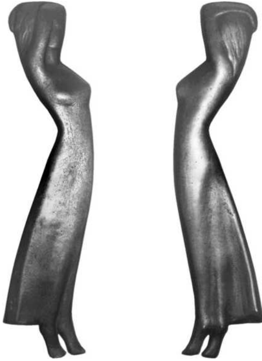
44 verkleind schaal ½