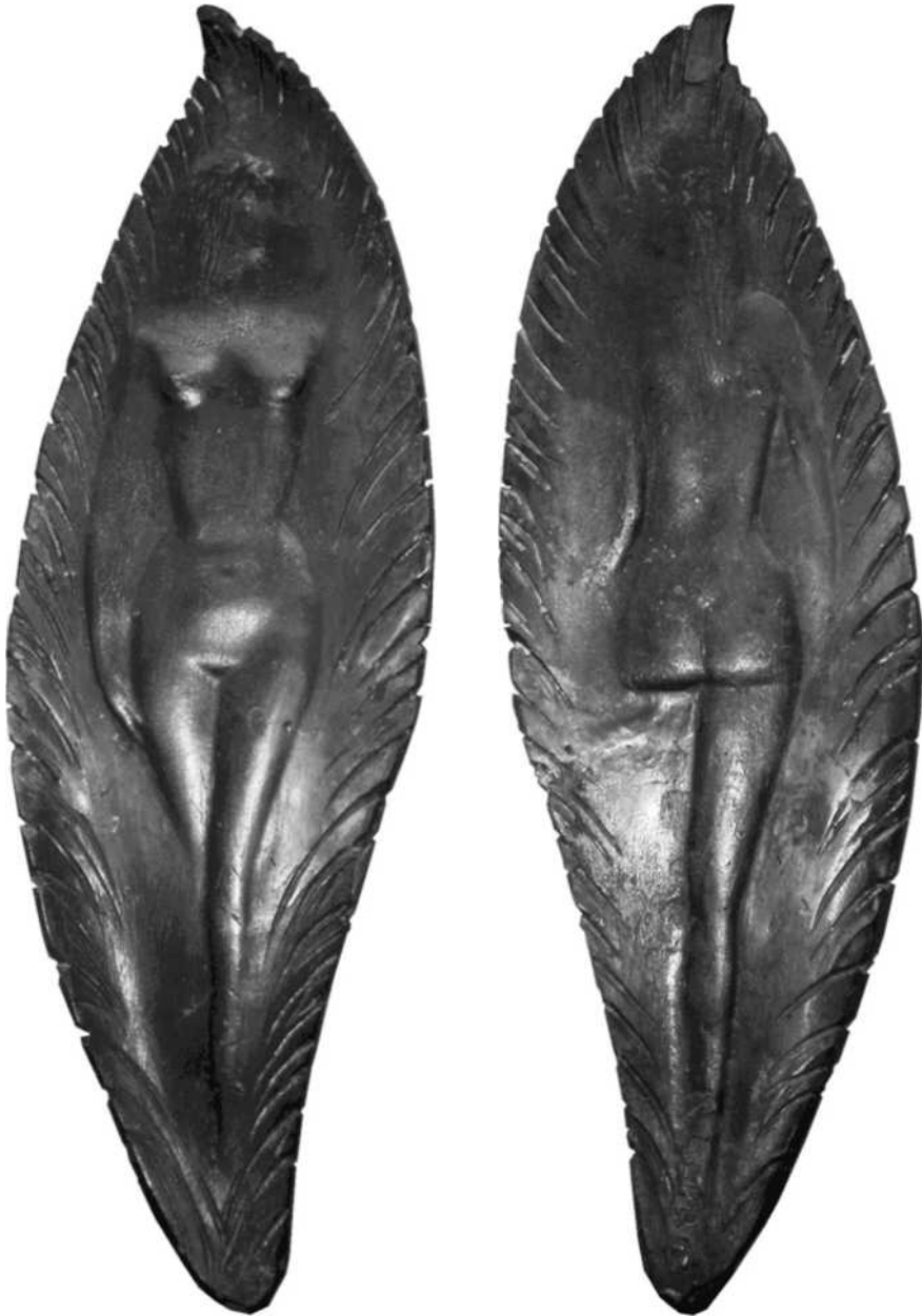
39 verkleind schaal \frac{1}{2}