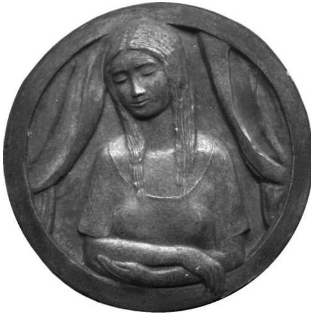
41 verkleind schaal ½