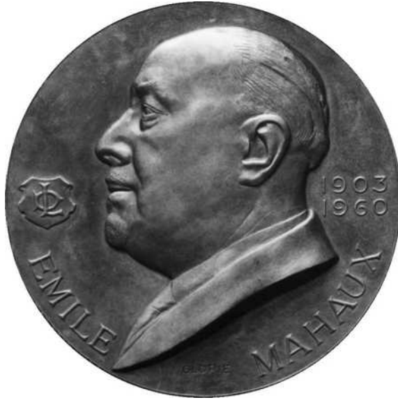
13 verkleind schaal ½