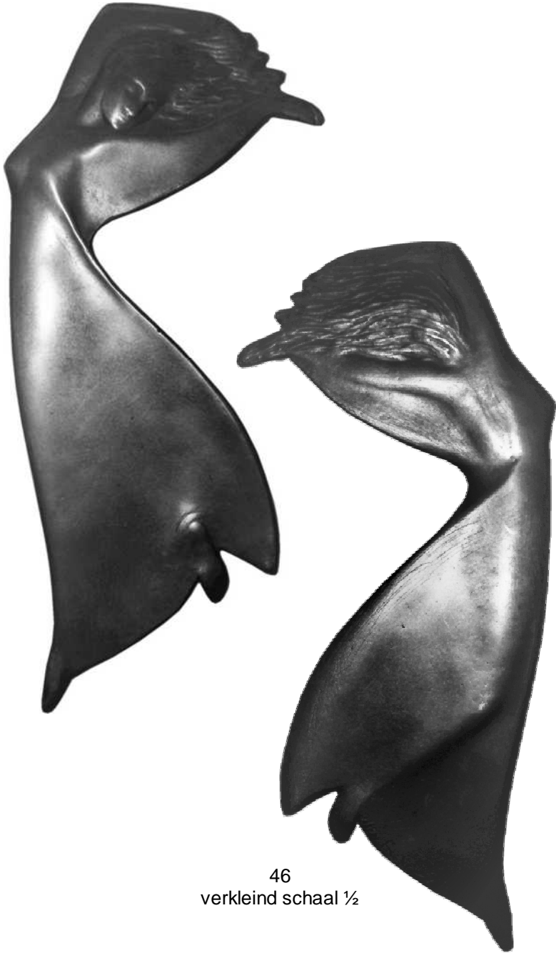
46 verkleind schaal ½