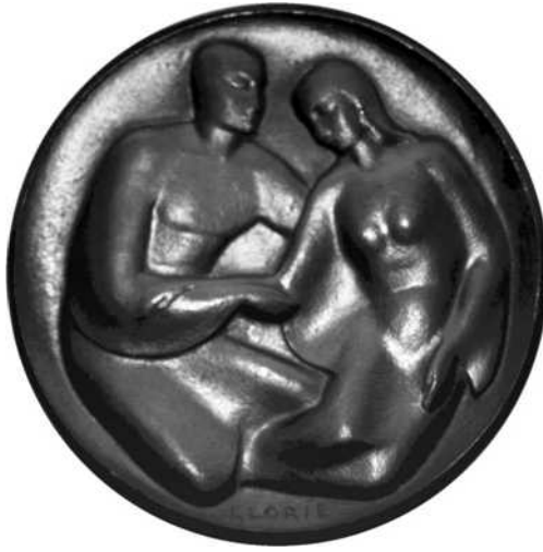
23 verkleind schaal ½