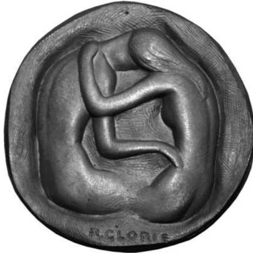
28 verkleind schaal ½