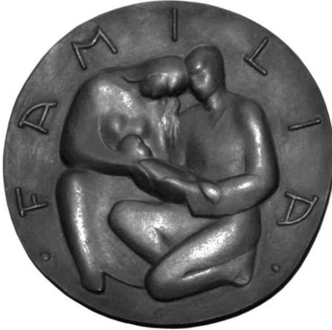
17 verkleind schaal ½