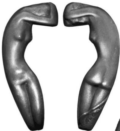
42 verkleind schaal ½