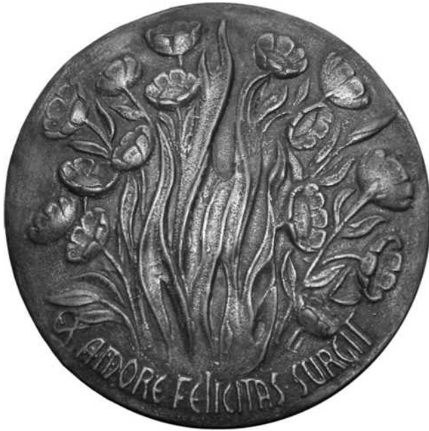
36 verkleind schaal ½