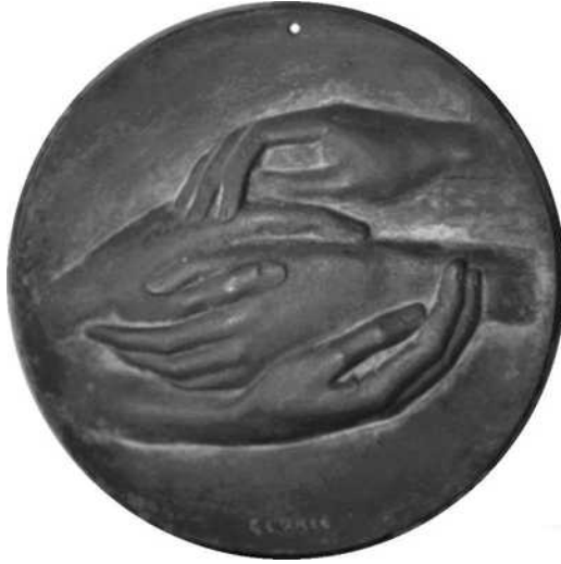
15a verkleind schaal ½