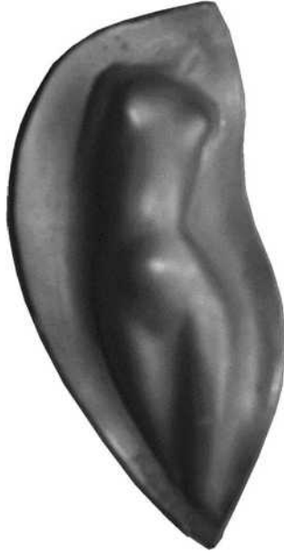
40 verkleind schaal ½